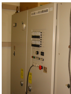
図2 大容量バイポーラ電源