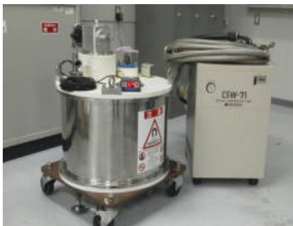
図1 伝導冷却マグネット